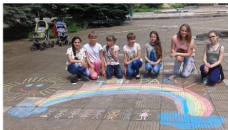
День защиты детей