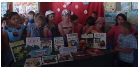
Жизнь замечательных зверей