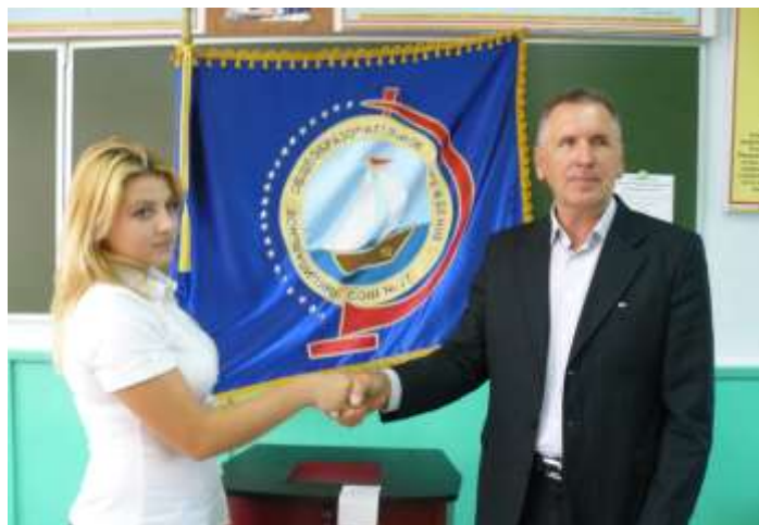
На фото: Президент школы принимает поздравления от Председателя ЦИК Ейского района.