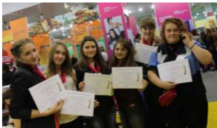
На фото: Юнкоры получили Сертификаты за участие в работе Форума «Радуга талантов»

Освещал деятельность форума пресс-центр «Красная строка». В работе которого приняли и юнкоры нашей школьной газеты «Поговорим».